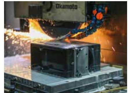
Wir Flach- und Rundschleifen.